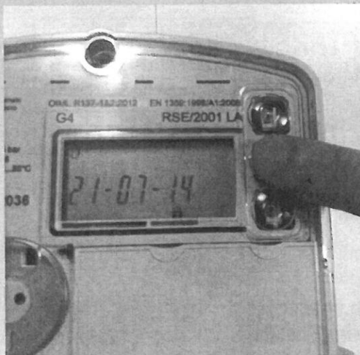
Premere 1 volta il tasto ENTER